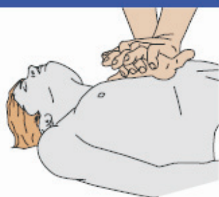
Stlačenie hrudníka 30x : Vdychy 2x